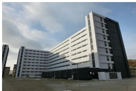
2016年 東町たいわ団地公営住宅 建替電気設備工事