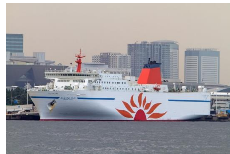
2015年 さんふらわあだいでつ火災修復 電気復旧工事